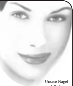
Unsere Nagelmodellistinnen sind staatlich geprüft.

Das Team von Studio Nord wünscht Ihnen einen angenehmen Aufenthalt.