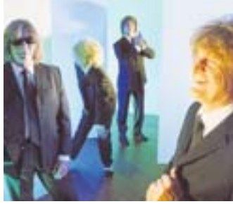
„The Lords“ rocken am 10. September in Unterrath.

Die Petrus-Kirche hat sich zum Veranstaltungsort für Konzerte entwickelt. Nachdem im März bereits „6-Zylinder“ dort aufgetreten sind, setzt sich die Event-Reihe am 6. Juni fort. Ab 17 Uhr werden dann die vier Comedians des „Comedy-Kleeblatts“ die Besucher begeistern. Karten kosten im Vorverkauf 19 Euro. Die Rockband „The Lords“, die seit fast 50 Jahren musikalisch aktiv ist, kommt am 10. September nach Unterrath. Das Konzert beginnt um 20 Uhr. Tickets gibt es zum Preis von 19 Euro im Vorverkauf. Zu einem Familienmusical lädt die Petruskirche am 5. November um 17 und 18.30 Uhr ein. Unter dem Titel „Der Weihnachtsmann“ gibt es eine unterhaltsame Aufführung für Groß und Klein. Mit dabei: die Band „6-Zylinder“.